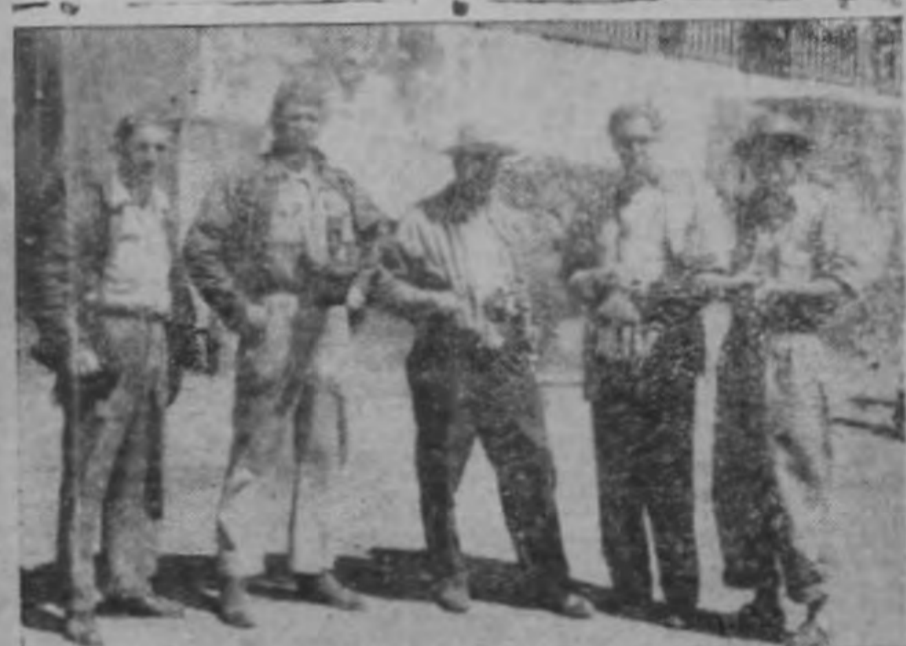
Grupo de corresponsales extranjeros, que en su mayoría cayeron en poder de los piratas invasores.