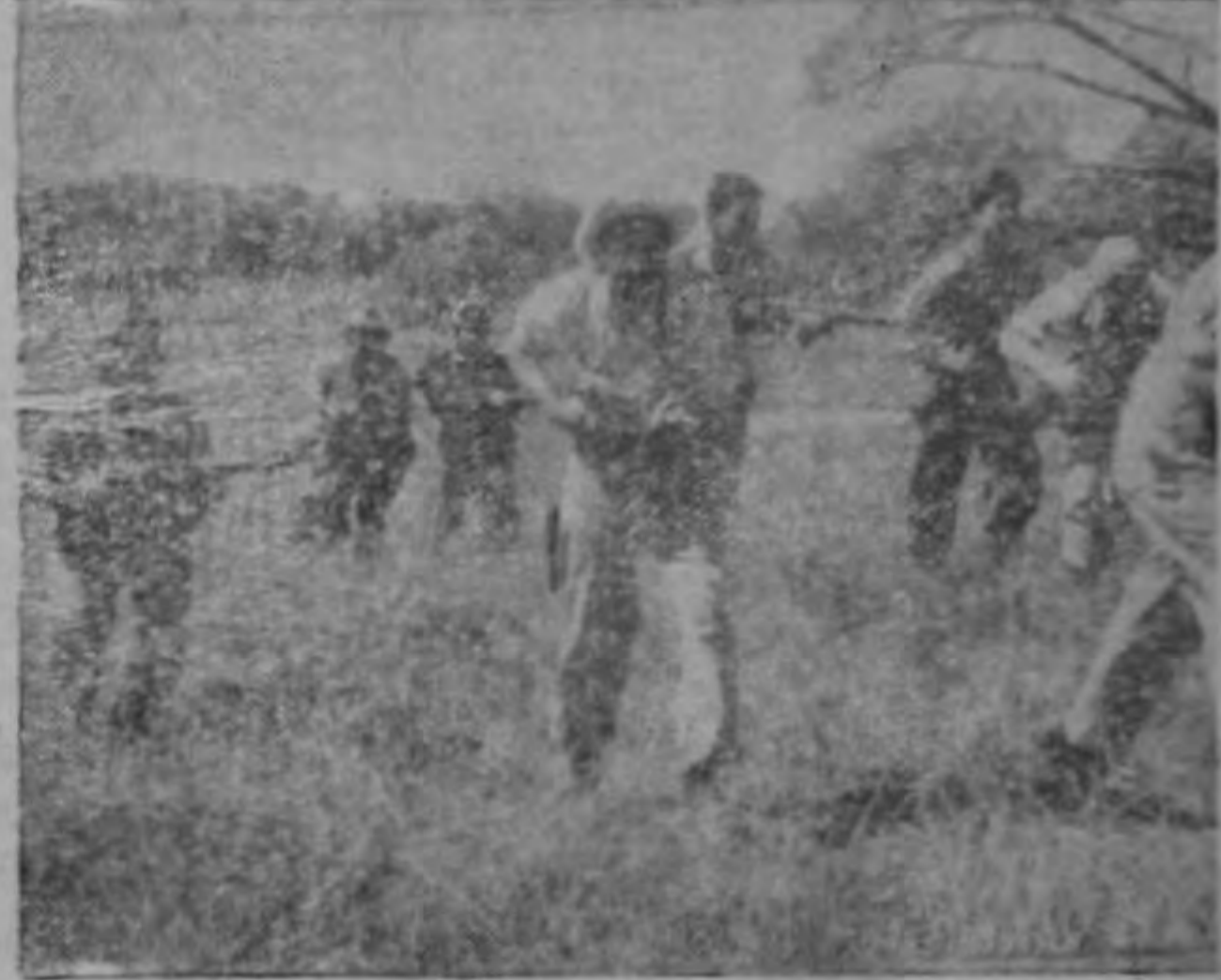
Listos para repeler el fuego de los invasores, los voluntarios avanzan valientemente para ir desalojando a aquéllos, y limpiar así el suelo costarricense del bandidaje agresor.—(Foto Tristán).