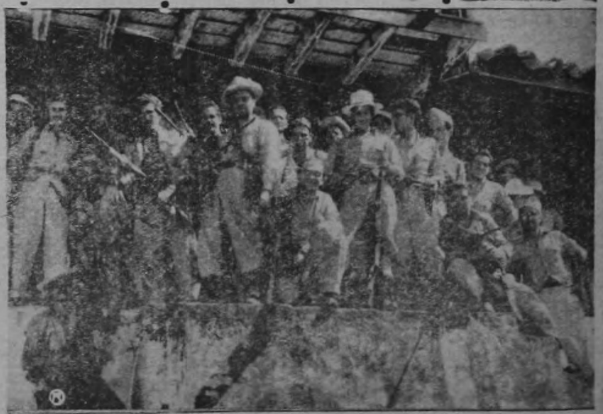
En la Hacienda Santa Rosa. Igual a 1856.